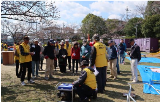
発電機の使い方の説明と体験

雨の合間に奇跡的に晴れた当日、なんとか3分咲きとなった桜の下で恒例の「防災お花見会」を実施しました。風が強く寒い一日となりましたが、「災害にお天気は関係ない！」との意気込みで、防災倉庫にある資機材を使った様々な啓発や、防災簡単クッキング「お湯ぽちゃ料理」などを勉強しました。当日は総勢250名のご参加をいただき、支部別の懇親会では和気あいあいと「顔の見える関係づくり」を深めることができました。