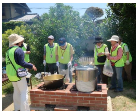
レトルトカレー湯せんの後、ゆで卵もつくりました。