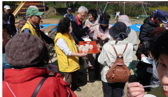
「お湯ぽちゃ料理」の試食、好評です！