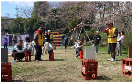
水消火器で消火訓練