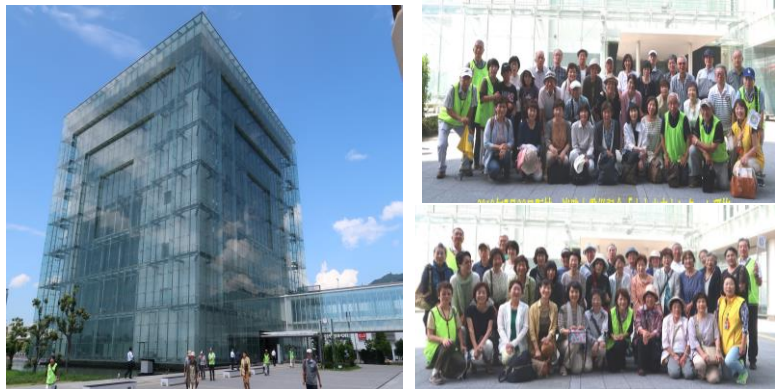
人と防災未来センター 参加者全員で撮影

昨年好評だった防災県外研修を実施し、今年は74名の皆様に参加いただきました。「人と防災未来センター」は、甚大な被害をもたらした阪神・淡路大震災の経験と教訓を継承し、防災・減災の実現のために必要な情報を発信する施設です。