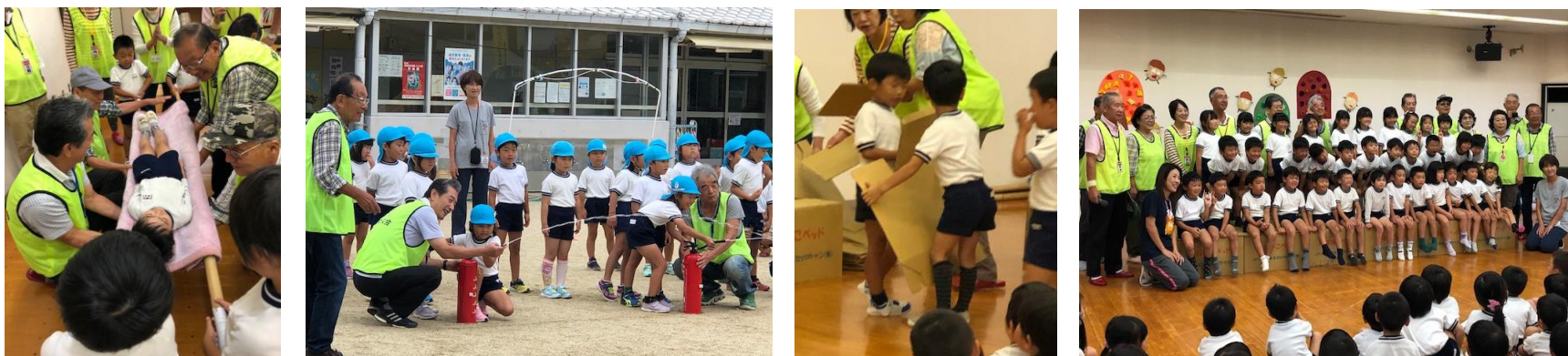
簡易たんか体験 水消火器体験(年長さん) 段ボールベッド組立 頑丈な段ボールベッドで記念撮影

毎年恒例となった「防災教室」。一年経つと園児の成長ぶりが感じられます。地震や家事が起こった時、とるべき行動の練習、水消火器訓練、毛布を使った簡易担架づくり、段ボールベッドの組立など、盛りだくさんのメニューをこなし、最後は年長さん全員が頑丈な段ボールベッドに乗り記念撮影しました。