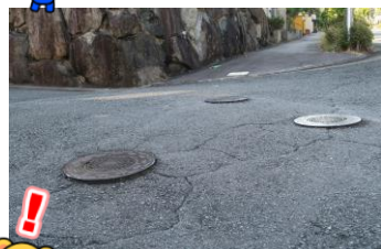
マンホール蓋の段差