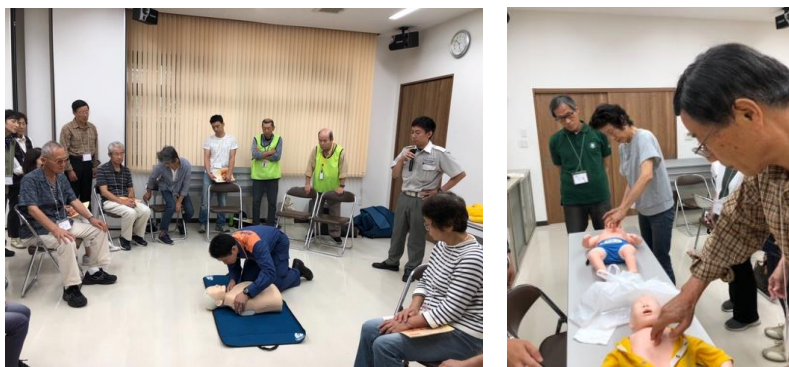
西和消防署の方による講習 子どものデモ機

心臓が止まると約4分で脳の細胞が死んでしまい、すぐに119番をかけても救急車が到着するまでに平均6分かかると言われています。もしもの時に備えて、適切な応急手当を身につける講習で毎年実施しています。(講習：奈良県広域組合西和消防署)