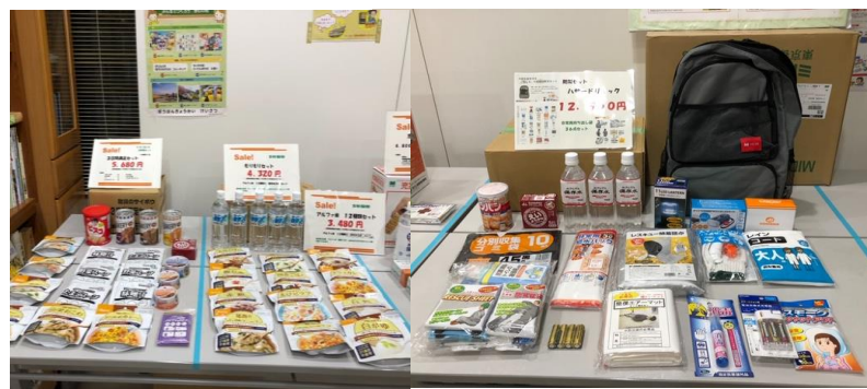
ロビーに展示した備蓄品(一部)

防災会のアンケートで要望の多かった防災備品の展示・販売を実施しました。「非常食セット」「非常用持ち出し袋」「段ボール組立トイレ」など、日ごろから備えておきたい備蓄品をピックアップし、集会所ロビーで3日間展示・販売しました。