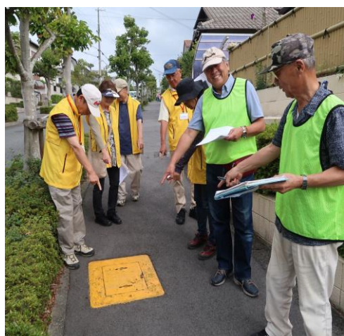
消火栓・防火水槽の位置確認