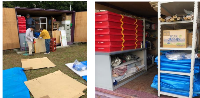
倉庫管理担当の皆さん スッキリと収納！

明神4丁目公園の防災倉庫2基の点検・整理を2日にわたり実施しました。暑い中、備品を一旦外に出し、点検しながら整理する作業は大変でしたが、真ん中に棚を設置して収納することで、何がどこにあるのか一目瞭然！スッキリと片付けました。