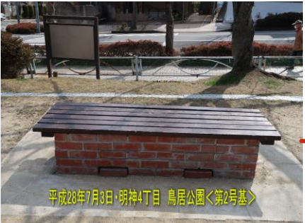
平成28年7月3日・明神4丁目 鳥居公園<第2号基> 第2号基（平成28年7月完成） 明神4丁目・鳥居公園