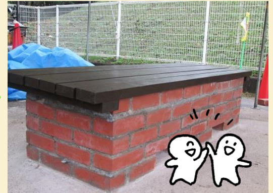
皆の力が結集した「かまどベンチ」完成！！