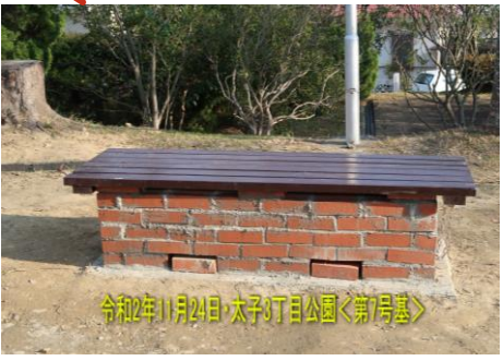
令和2年11月24日・太子3丁目公園<第7号基> 第7号基（令和2年12月完成） 太子3丁目児童公園