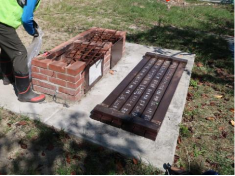
平成28年12月完成 第3号基（平成28年12月完成） 明神4丁目・鳥居公園