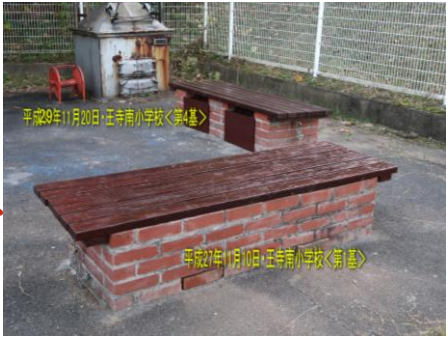
平成29年11月20日・王寺南小学校<第4号基> 平成27年11月10日・王寺南小学校<第1号基> 第1号基（平成27年11月完成） 第4号基（平成29年11月完成） 王寺南小学校グラウンド