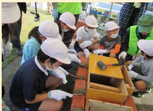
二段目からは、4年生児童の出番です。セメントをコテで丁寧に塗っていきます