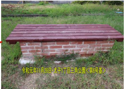
令和元年11月26日・太子1丁目三角公園<第6号基> 第6号基（令和元年11月完成） 太子1丁目・三角公園