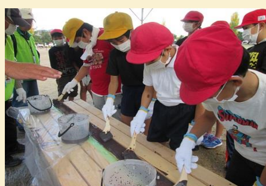
座板のペンキ塗り。みんな慎重にキレイに塗ってくれます。これで座板が強くなります