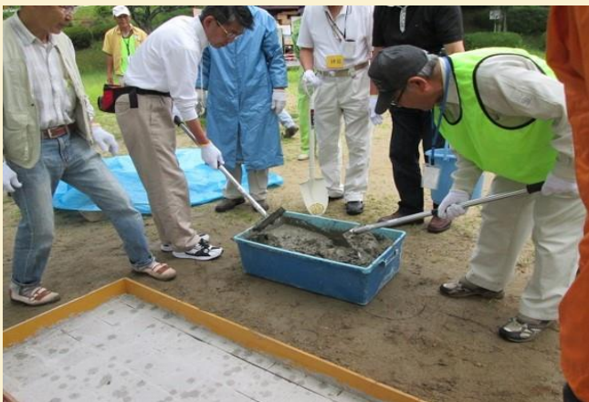
鉄筋を入れ、セメントを流してしっかりとした基礎を作ります