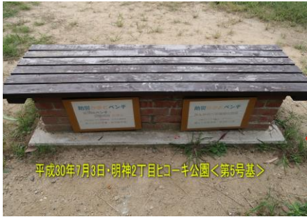
平成30年7月3日・明神2丁目ヒコーキ公園<第5号基> 第5号基（平成30年7月完成） 明神2丁目・ヒコーキ公園