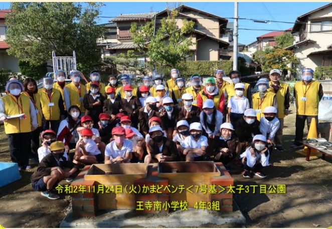
令和2年11月24日（火）かまどベンチ<7号基>太子3丁目公園 王寺南小学校 4年3組 令和2年11月、第7号基の製作 南小の児童と防災会の協働作業