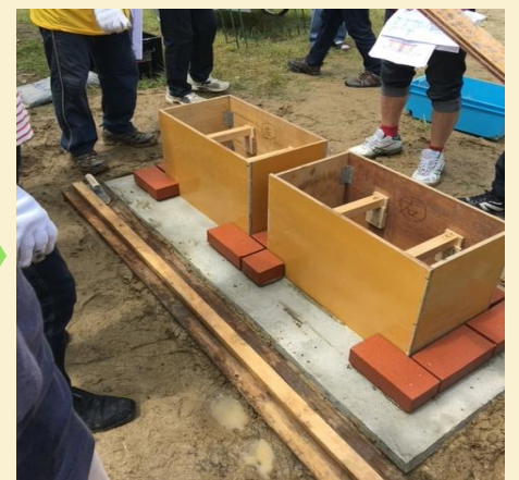
一段目だけレンガを乗せて枠をはめます