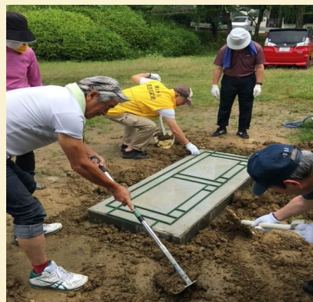
レンガを置く位置を決める型枠を乗せます