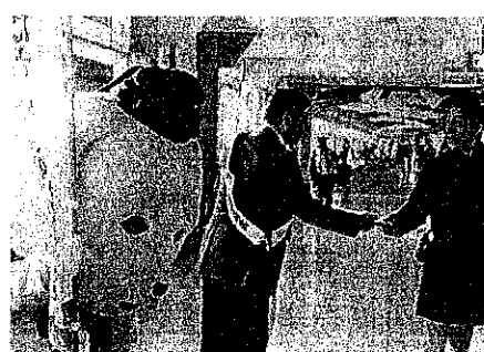
歳末たすけあい募金