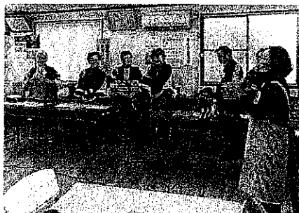
サロン活動の推進